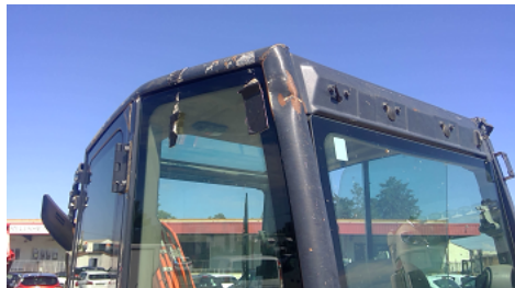
Observation 0603 : Détérioration STRUCTURE DE PROTECTION ROPS TOPS COIN ARRIERE GAUCHE ENFONCE