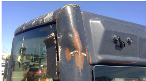
Observation 0603 : Détérioration STRUCTURE DE PROTECTION ROPS TOPS COIN ARRIERE GAUCHE ENFONCE