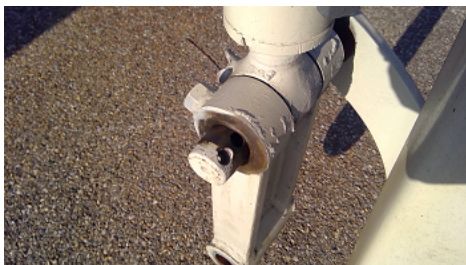
Observation 0302 : ARRET AXE MANQUANT SUR SYSTEME ACCESSOIRE