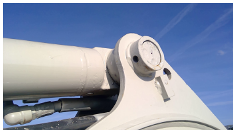
Observation 0302 : ARRET AXE MANQUANT SUR LIAISON VERIN DE BALANCIER / FLECHE